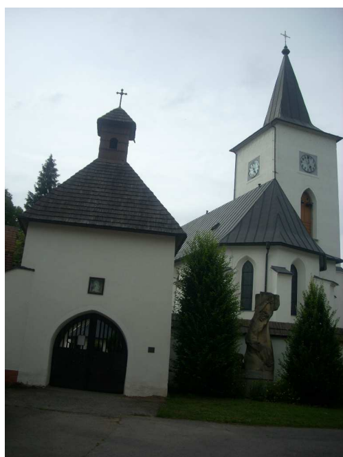
kostel ve Velké Losenici – Josefova svatba

Velkou zajímavostí je to, že noví osadníci sem přicházejí z východních Čech a jsou všichni evangelického vyznání. Vzhledem k tomu, že už byl více než 40 let v platnosti toleranční patent Josefa II. nemusí jít o násilné přesídlení. Pravdou však je to, že minoritní evangelíci většinou nacházeli místo pro svoje komunity v odlehlejších částech země. Šlakhamry se tak z hlediska konfesijního velmi odlišují od ostatních částí Hamrů nad Sázavou. Ještě v roce 1930 je tato změna ve vyznání markantní – oproti jinde převažujícím 13 katolíkům je zde 37 evangelíků. Od počátků jsou přiřazeni k evangelické farnosti v Sázavě, katolíci mají samozřejmě centrum farnosti ve Žďáře. Oddávalo se ve Velké Losenici.